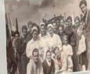
Przewodniczący GS „Samopomoc Chłopska” wraz z gospodarzami indywidualnych sklepów w Nowej Wsi Wielkiej