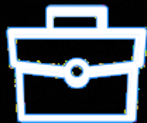
Oferty - tryb pozakonkursowy