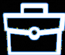
Oferty - tryb pozakonkursowy