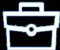
Oferty - tryb pozakonkursowy