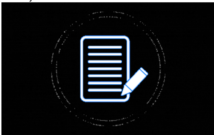
Zaświadczenia i wnioski