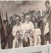
Przewodniczący GS „Samopomoc Chlopska” wraz z gospodarzami (gospodyni) w Nowej Wsi Wielkiej.