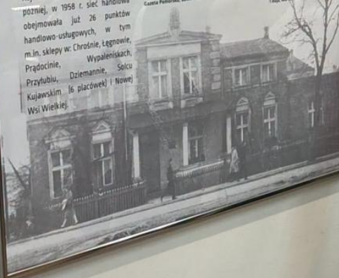
Gazeta Pomorska, 22.06.1960 r.