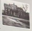
Siedziba Urzędu Gminy w Solcu Kujawskim przy ul. 23 Sierpnia, w której znajdowała się także pomieszczenia GS „Samopomoc Chlopska”.

GS „Samopomoc Chlopska” prowadziła też lokale gastronomiczne i sklepy, głównie na terenach wiejskich. Rok później w 1949 r. uruchomiono sklepy w Przybubiu, Wypaleniskach, Dąbrowie Wielkiej, młyn w Otorowie i masarnię w Solcu Kujawskim, a niespełna 10 lat później, w 1958 r. sieć handlowa obejmowała już 26 punktów handlowo-usługowych, w tym m.in. sklepy w: Chrośnie, Legionwie, Prądocinie, Wypaleniskach, Przybubiu, Dziemannie, Solcu Kujawskim (6 placówek) i Nowej Wsi Wielkiej.