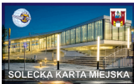
SOLECKA KARTA MIEJSKA

Ofertę zaprezentowali przedstawiciele przewoźnika na styczniowym spotkaniu