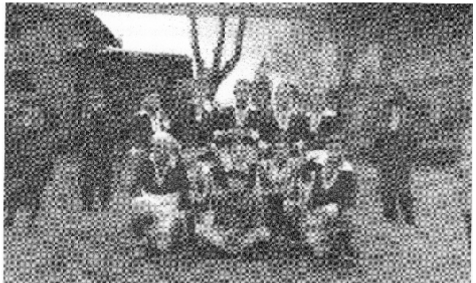
Najstarsze zdjęcie piłkarskiej drużyny Unii zrobione w 1926 roku na dawnym soleckim targowisku.

Początek o godz. 15.00 . Zapraszamy mieszkańców do licznego udziału. Wstęp na mecz za darmo . Będą też dotychczasowe atrakcje dla publiczności.