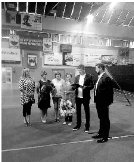
Były urodzinowe życzenia i tort.

Natomiast klub został wyróżniony srebrną odznaką PZPN.