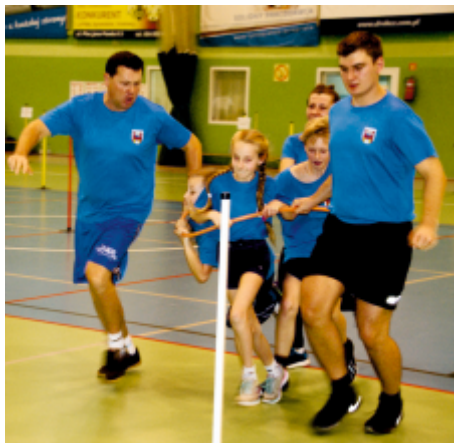
Dorośli na zewnątrz, w obręczy bieglą dzieci.