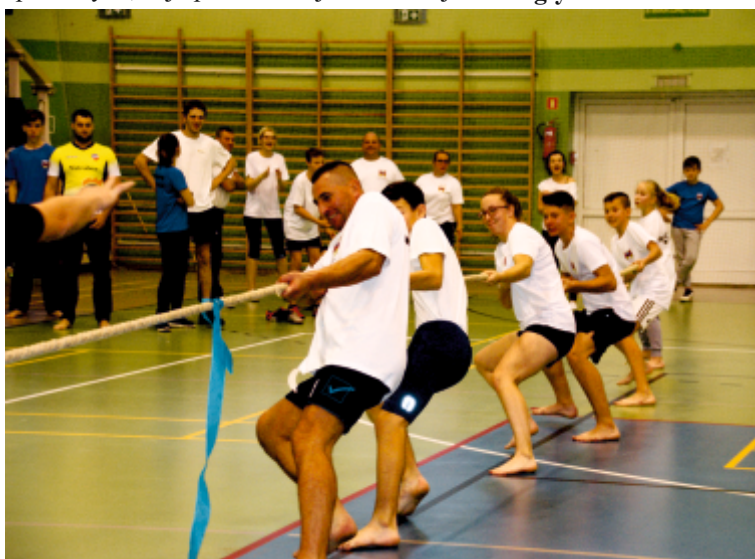
Przeciąganie liny to bardzo emocjonująca konkurencja.

nagrodzeni zostali medalami, zaś czołowe trzy drużyny łącznej klasyfikacji generalnej otrzymały piękne statuetki. Nagrodzono również kibiców, którzy najatrakcyjniej dopingowali swoją drużynę – tu pierwszeństwo przypadło kibicom Osiedla Staromiejskiego. Organizatorami festynu byli: Gmina Solec Kujawski, Starostwo Powiatowe w Bydgoszczy, Międzyszkolny Uczniowski Klub Sportowy „Start” oraz Ośrodek Sportu i Rekreacji.