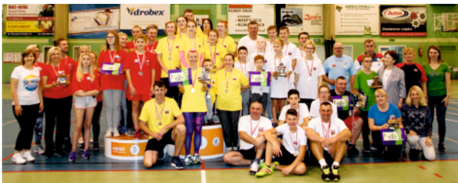
Medaliści dumnie pozowali do wspólnej fotografii.