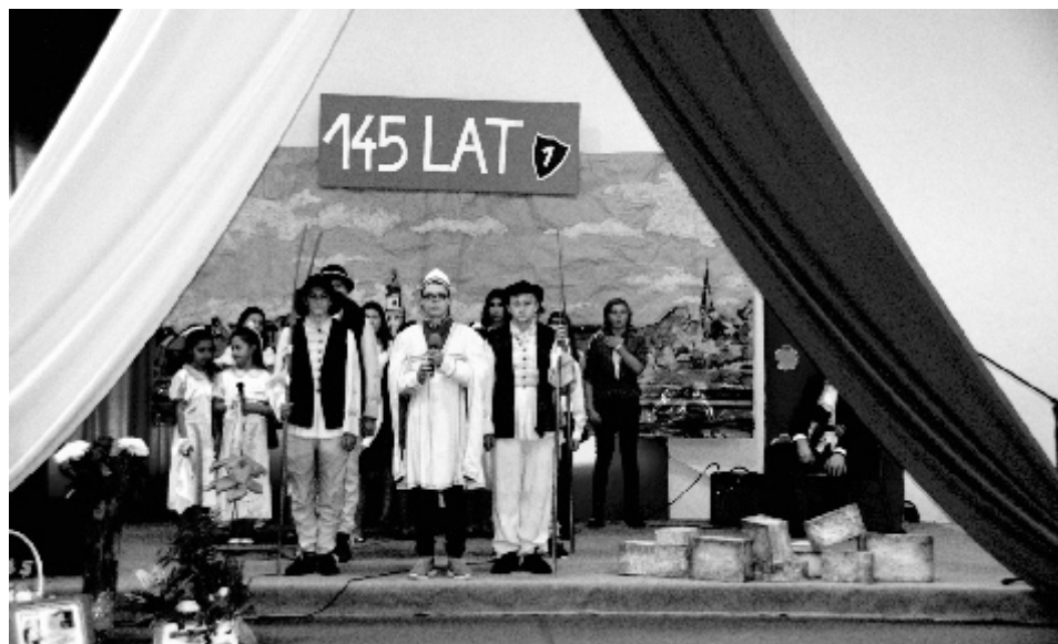
Ponieważ patronem szkoły jest Tadeusz Kościuszko, odtworzono jego przysięgę na krakowskim rynku.