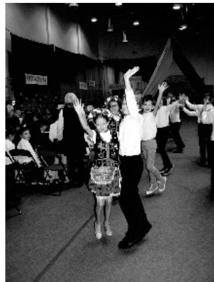
Uczniowie zatańczyli poloneza i krakowiaka.