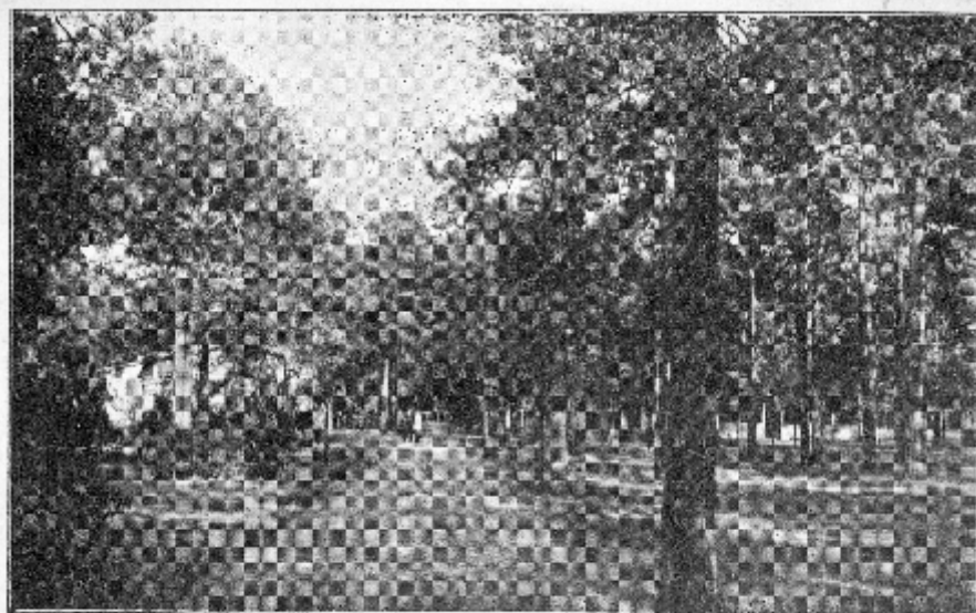
SOLEC KUJAWSKI Park Miejski

Park Miejski jest od wielu lat popularnym miejscem spędzania wolnego czasu. Nie inaczej było w dwudziestoleciu międzywojennym. Poza możliwością spaceru parkowymi alejkami, solecczanie mogli pójść w stronę boiska, pokibicować sportowcom Unii rywalizującym w rozgrywkach piłki nożnej lub lekkiej atletyki.