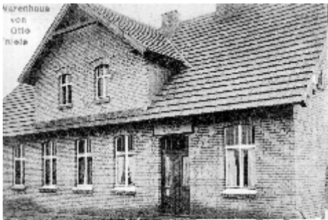
Grüb aus Krossen