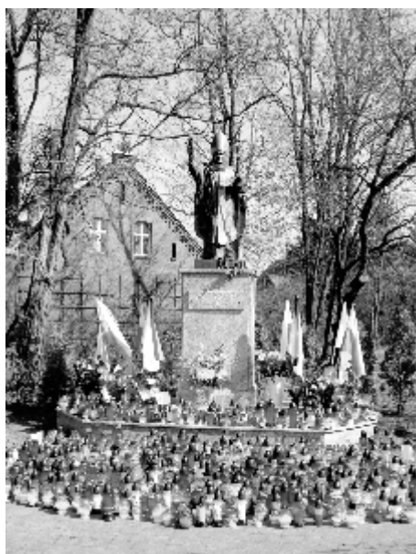
2 kwietnia 2005 r. zmarł papież Jan Paweł II. Od tego momentu minęło 15 lat... Zdjęcie wykonane 4 kwietnia 2005 r.