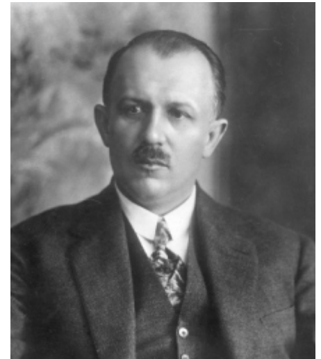
Kazimierz Bartel

Jako wielokrotny premier stał się jedną z ważniejszych osób wziętych do niewoli przez zajmujących Lwów Niemców. Jego pozycja i autorytet miały pomóc stworzyć „polski rząd”, który działałby pod dyktando niemieckiego okupanta. Ten plan przyczynił się do lepszego traktowania więźnia. Nie trwało to jednak długo. Gdy