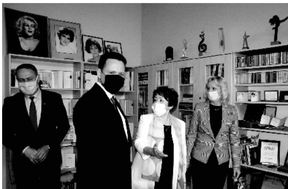
Wizyta w Saloniku Ireny Santor.