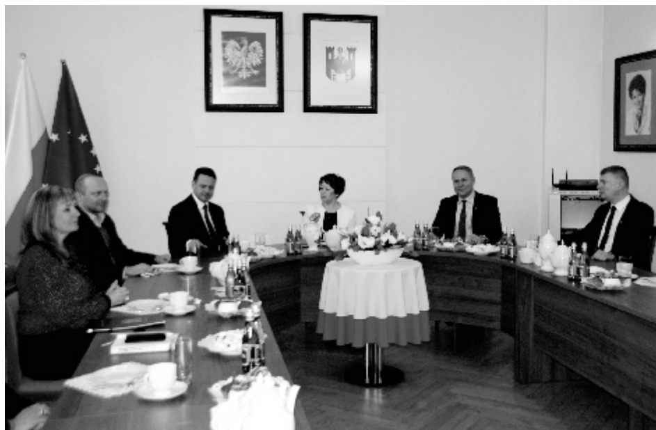
Rozmowa w sali konferencyjnej urzędu.