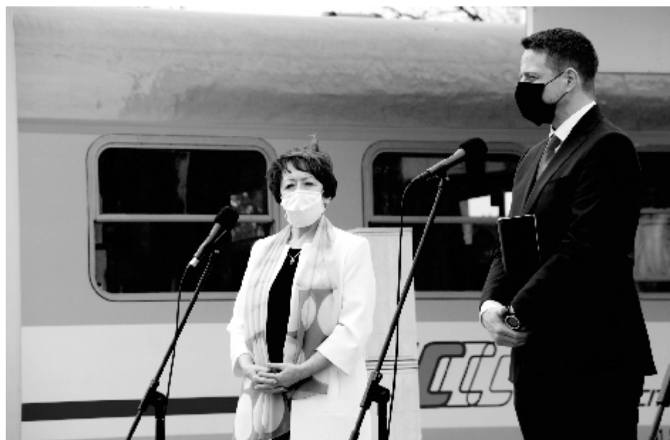
Podczas konferencji prasowej.