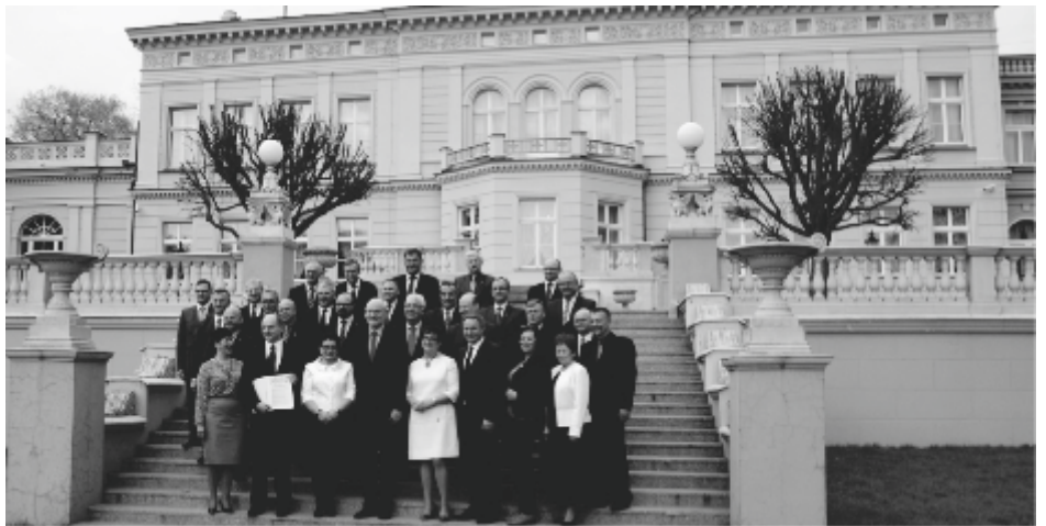
Kwiecień 2014 r. Pałac w Ostromecku. Uroczyste podpisanie porozumienia o utworzeniu ZIT-u.

powinien zostać wyznaczony jeden obszar ZIT obejmujący oba ośrodki wojewódzkie i Bydgoszcz i Toruń. W przyjętych założeniach do strategii województwa zaproponowano elastyczne ramy wyznaczania obszaru ZIT, w tym