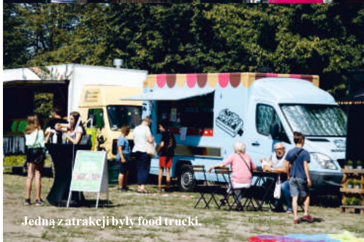
Jedną z atrakcji były food trucki.