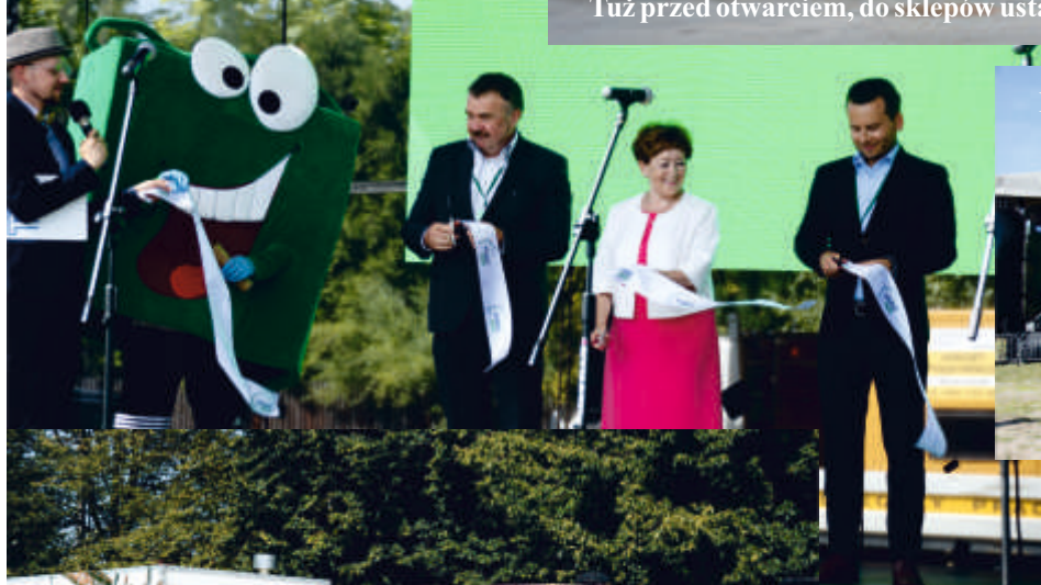
Na scenie również dużo się działo.

Było poświęcenie i tradycyjne przecięcie wstęgi