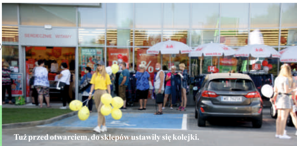
Tuż przed otwarciem, do sklepów ustawiły się kolejki.

Galeria Vendo Park, pierwsza w województwie kujawsko-pomorskim otwarta. Po oficjalnej części zaproszono sołeczan do korzystania z przygotowanych na ten dzień atrakcji.