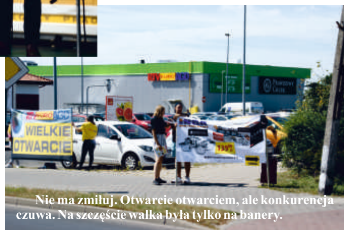
Nie ma zmiłuj. Otwarcie otwarciem, ale konkurencja czuwa. Na szczęście walka była tylko na banery.