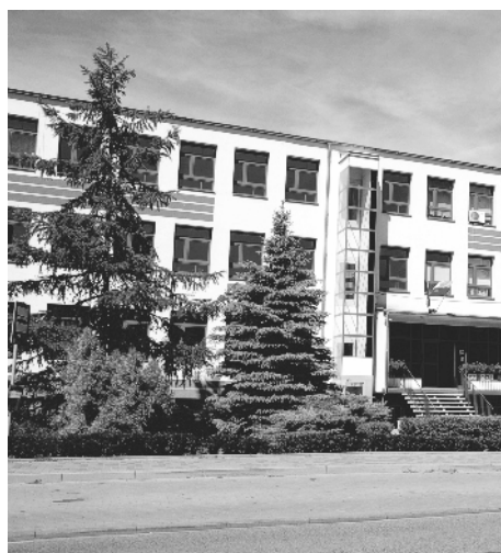
Szkoła Podstawowa nr 4 im. Marii Skłodowskiej-Curie.

Dziecko w wieku 6 lat, które nie pójdzie do I klasy szkoły podstawowej, jest zobowiązane do odbycia rocznego