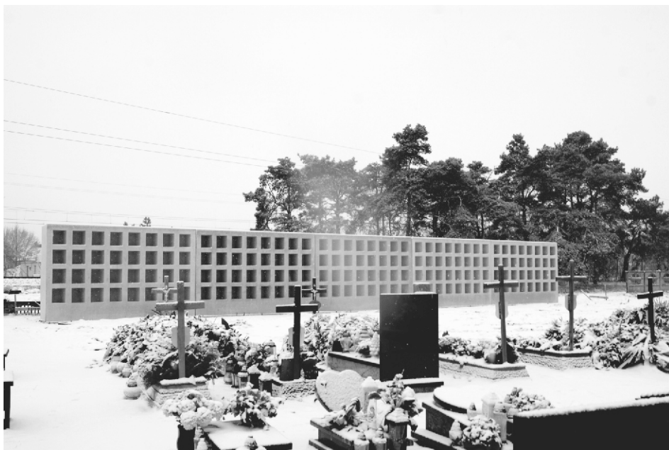
Kolumbarium znajduje się w części cmentarza od strony torów kolejowych.

- Postawiony jest główny obiekt. Przed nim ma pojawić się chodniczek na którym będzie można ustawiać znicze. W przyszłości góra obiektu będzie zabezpieczona. W wypadku zainteresowania pochówkami