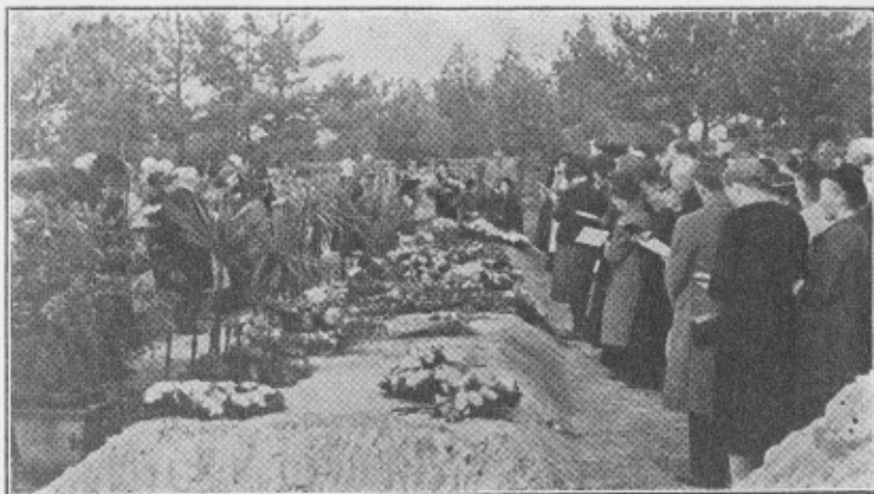
Feier am Massengrab der Mordopfer in Schulitz Sept. 1939