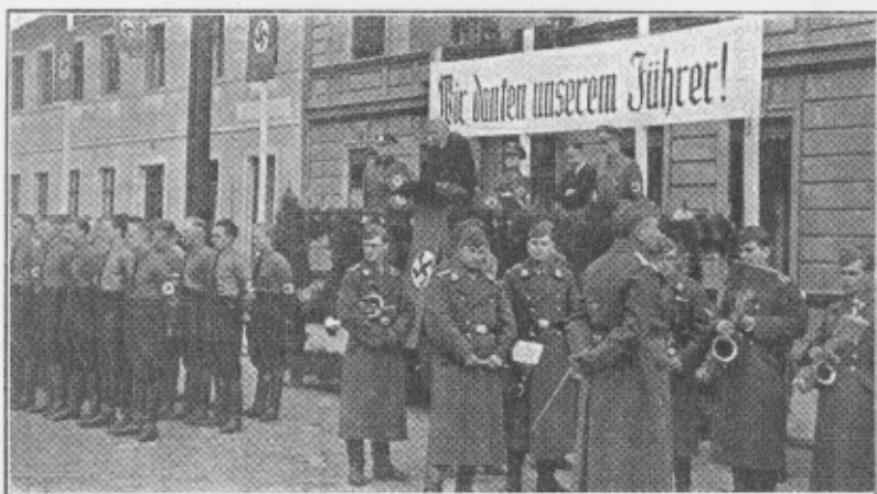
Erste nationalsozialistische Kundgebung in Schulitz Okt. 1939