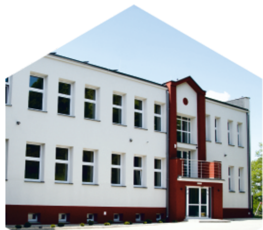
ul. Kościuszki 12

- To, co najistotniejsze, o czym zawsze mówią mieszkańcy i chcieliby, aby było zrealizowane w pierwszej kolejności czyli ulice, oświetlenie, chodniki. Udało nam się pozyskać pieniądze z Funduszu Dróg Samorządowych i rozpoczęliśmy prace na Osiedlu Leśnym. Na początek te główne ciągi komunikacyjne: Prosta, Zbożowa, Łąkowa. Do wykonania podstawowego szkieletu zostanie nam jeszcze odcinek ul. Wiejskiej. Zamierzamy starać się o dofinansowanie. Czy się uda? Nie wiem. Ważną inwestycją jest łączenie wcześniej wybudowanych odcinków ścieżek rowerowych. Część była wykonywana w ramach innych inwestycji, jak na przykład tunelu, czy drogi powiatowej przez Otorowo. Teraz kontynuujemy te prace. Warto było je zrealizować. Widzę jak ze ścieżek korzystają całe rodziny.