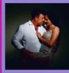
Mirage & Joko