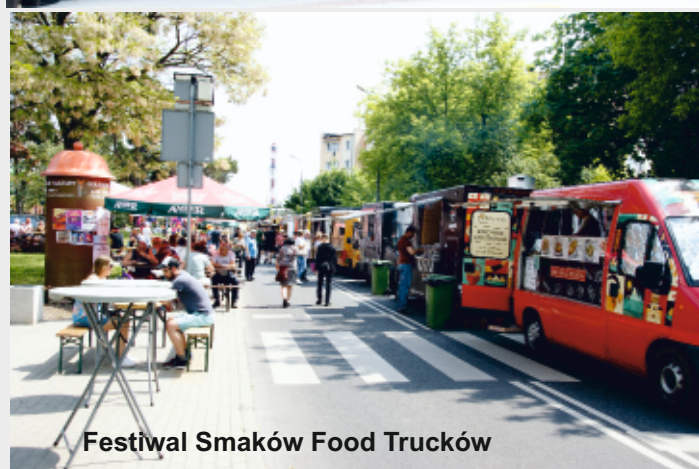
Festiwal Smaków Food Trucków