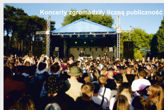
Koncerty zgromadziły liczną publiczność