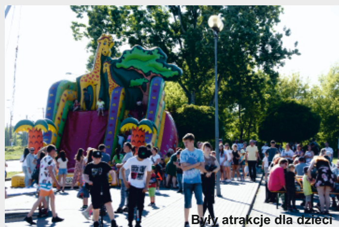
Były atrakcje dla dzieci