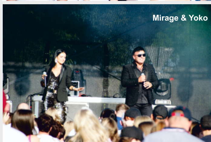
Mirage & Yoko