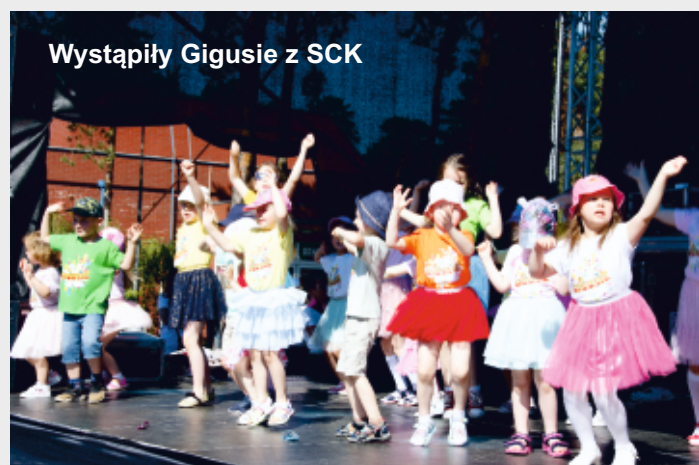
Wystąpiły Gigusie z SCK