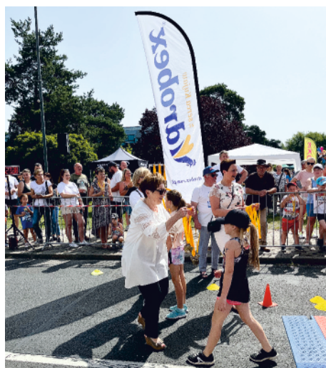
Każdy po ukończeniu biegu otrzymał pamiątkowy medal. Także nordic walkingowcy.