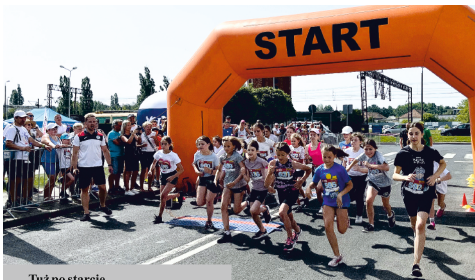
Tuż po starcie...