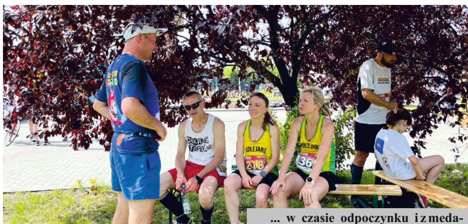
... w czasie odpoczynku iz medalami.