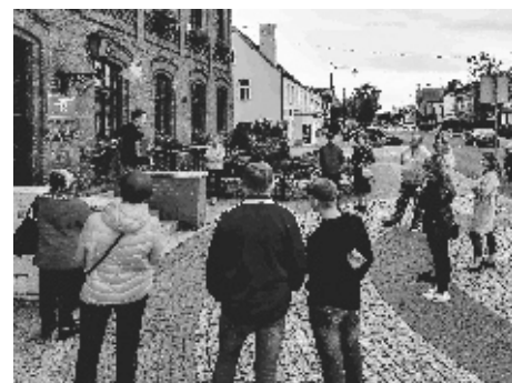
Spacer historyczny śladami H. Tellera i R. Schillera.