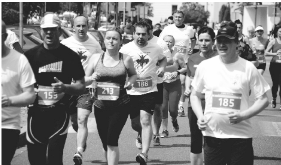
W czasie biegu słoneczna aura mogła dać się we znaki. Aby nieco ulżyć biegaczom, nasi strażacy rozstawili kurtynę wodną, do której za chwilę dobiegną zawodnicy.