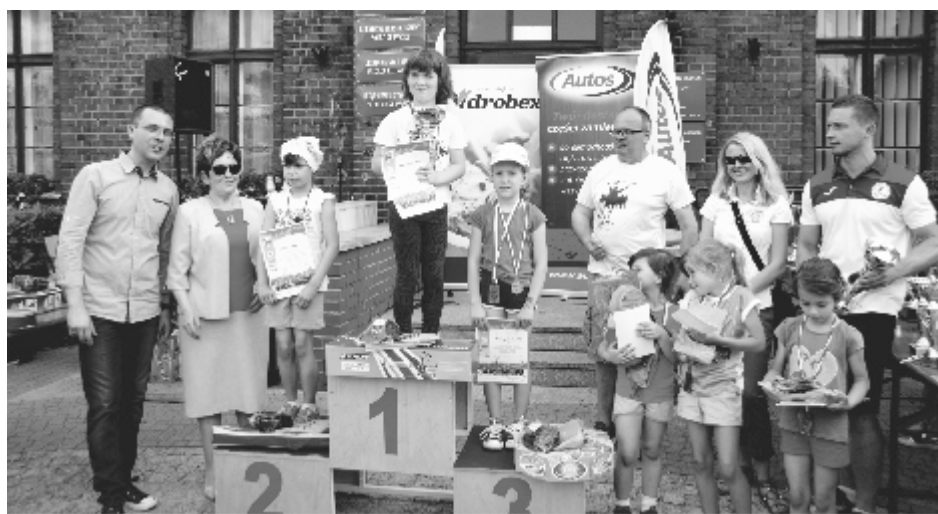
Dekoracja najmłodszych uczestników biegu.