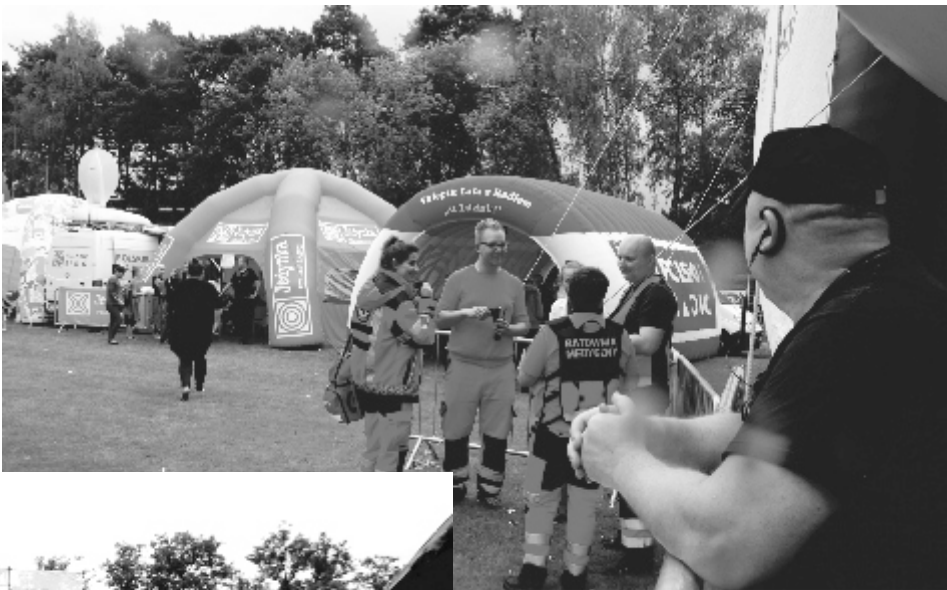
O bezpieczeństwo w czasie imprezy dbały ochrona i ekipa medyczna.