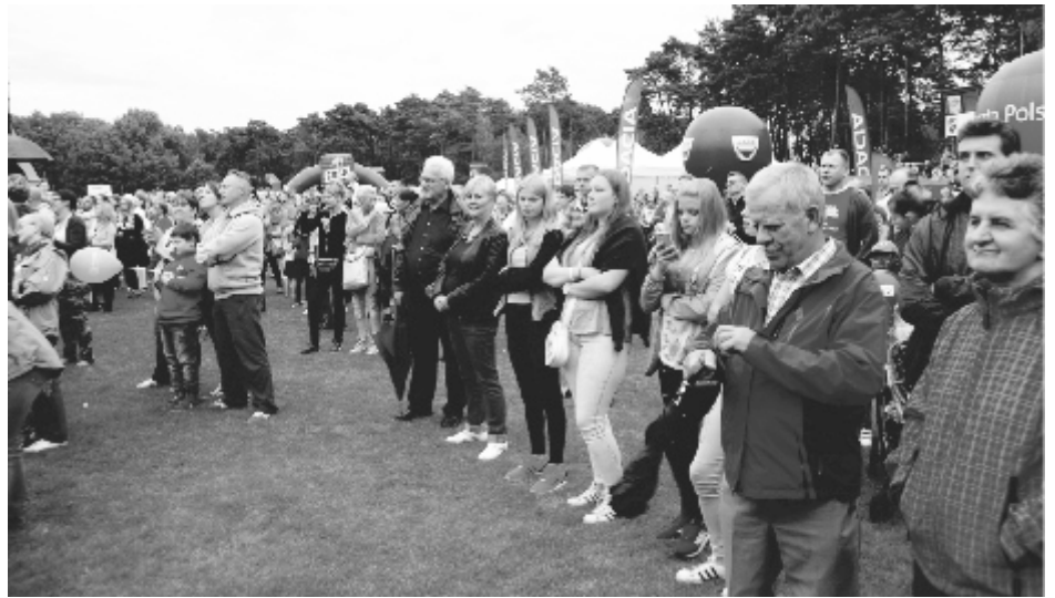
Solecki stadion odwiedzili nie tylko mieszkańcy gminy. Bawili się u nas również mieszkańcy regionu.