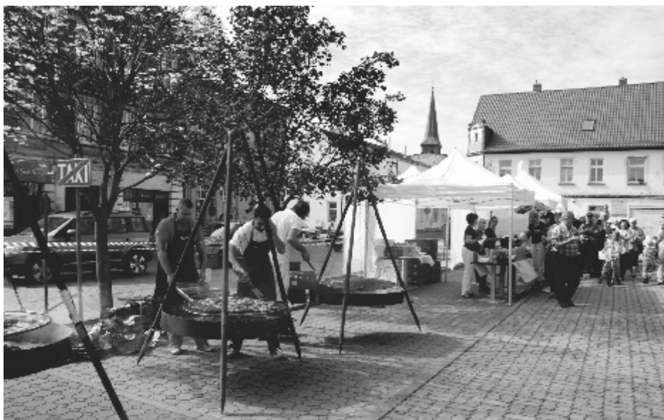
Dania serwowane przez firmę Drobex bardzo smakowały uczestnikom dożynek.