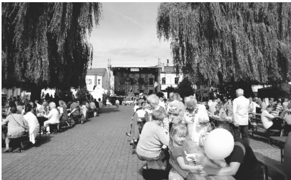
Pogoda dopisała. Na rynek przyszło wielu mieszkańców naszej gminy. Uroczystości dożynkowe przygotowane przez urząd miasta i SCK przebiegły pod znakiem dobrej rozrywki. Pl. Jana Pawła II tętnił życiem aż do zmroku.