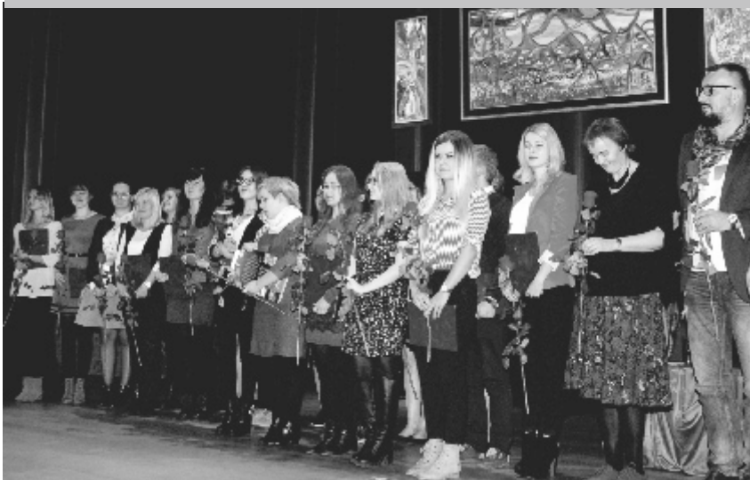
Grupa studentów Uniwersytetu Technologiczno - Przyrodniczego, nagrodzonych i wyróżnionych w konkursach ogłoszonych przez gminę. Na zdjęciu razem z dójką wykładowców.