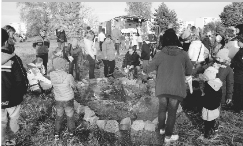
Na pikniku, mieszkańcy mogli się posilić, ale i ogrzać przy ognisku. Mimo że tego dnia było słonecznie, to wiał zimny wiatr.