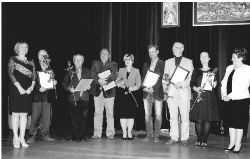
Burmistrz wraz ze swoim zastępcą podziękowały wszystkim osobom szczególnie zaangażowanym w realizację projektu rekultywacji.