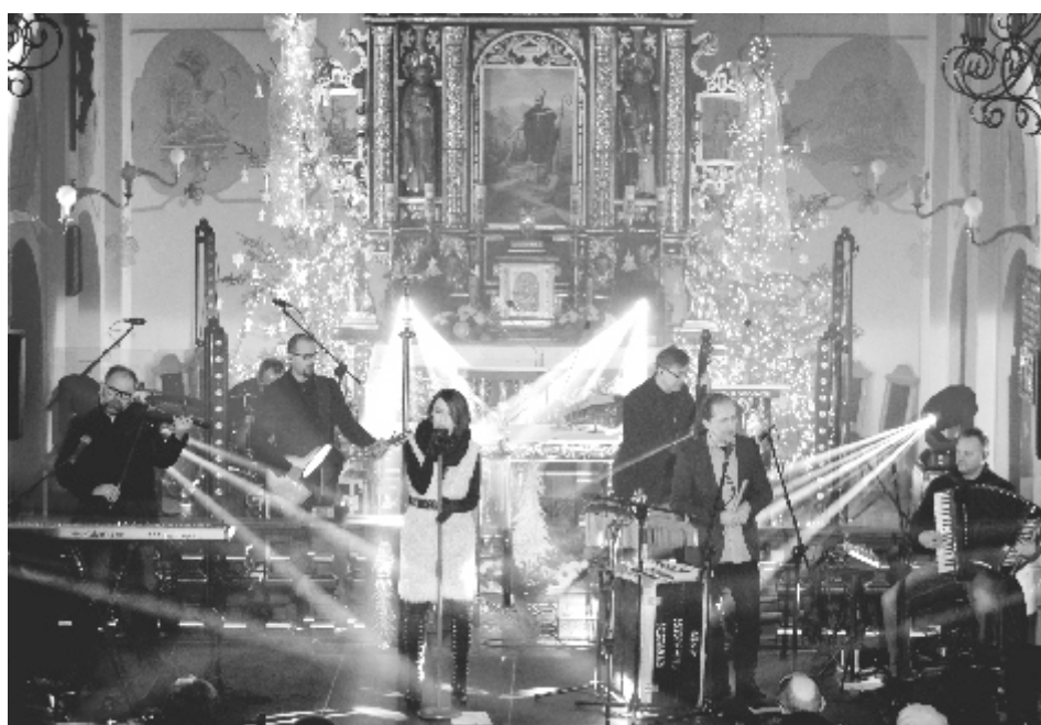
Na zaproszenie urzędu miasta, 15 stycznia br. w kościele Św. Stanisława z koncertem kolęd wystąpił zespół Brathanki. Solecka publiczność pomogła, śpiewając razem z artystami najpiękniejsze polskie kolędy.