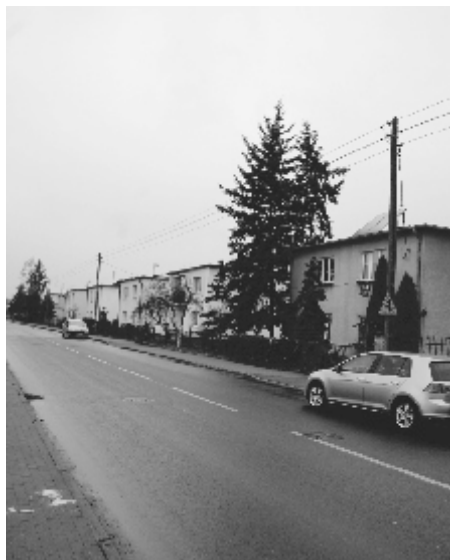
Dokończenie na str. 3

Składam wszystkim Paniom, mieszkankom gminy Solec Kujawski, najserdeczniejsze życzenia z okazji zbliżającego się Dnia Kobiet.