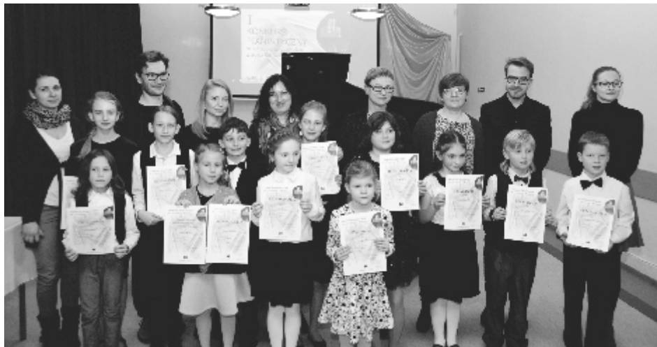
Laureaci konkursu wraz z członkami jury i swoimi nauczycielami.