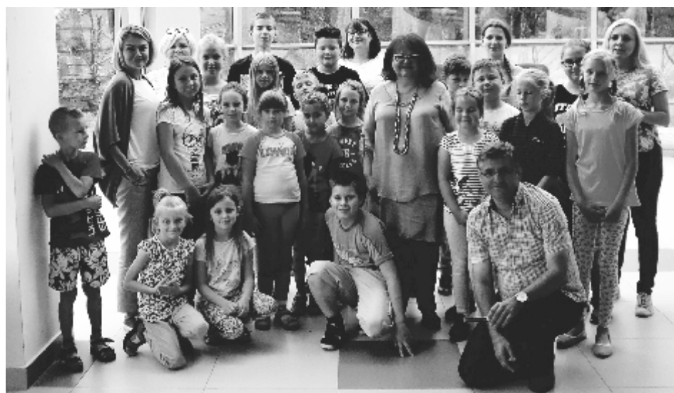
Trwają wakacje w Soleckim Centrum Kultury. Zapraszamy!

Przez całe wakacje od poniedziałku do piątku od 15.00 do 17.00 SCK zaprasza na zajęcia plastyczne ARTYSTYCZNA PRACOWNIA PANA HENIA