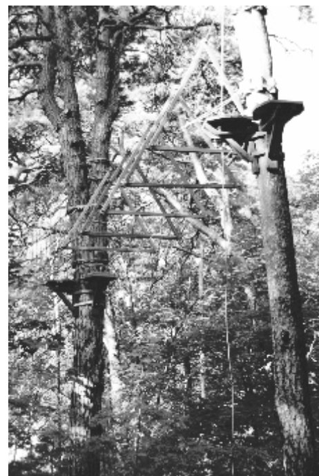
Fragment jednej z tras w soleckim parku linowym.

Park będzie działał od wiosny do jesieni, od rana do zmierzchu. Jeżeli pogoda pozwoli, niewykluczone, że z atrakcji parku będzie można skorzystać także zimą. Jak powiedział nasz rozmówca, solecki park linowy nie jest pierwszym prowadzonym przez firmę. Inwestor