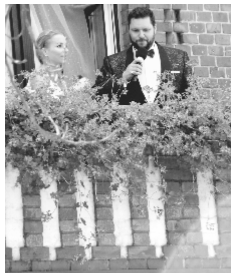
Balkon urzędu zamienił się w scenę, z której popłynęła patriotyczna pieśń.

Następnego dnia – 1 września, w rocznicę wybuchu II wojny światowej, delegacje złożą wiązanki w miejscach pamięci narodowej. Zbiórka pocztów sztandarowych 1 września przed urzędem o godz. 11.45. Z okazji obu rocznic, w okresie od 30 sierpnia do 4 września (do godz. 8.00), burmistrz zarządziła flagowanie budynków użyteczności publicznej oraz ulic.