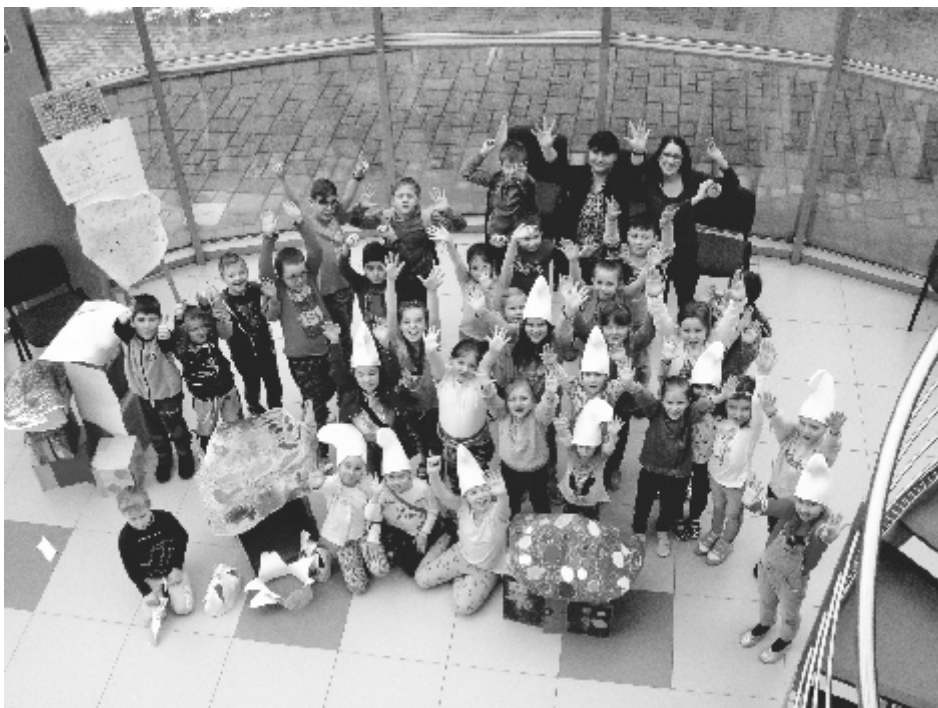
Uczestnicy ferii zimowych organizowanych w SCK wspaniale się bawili. Za rok zapewne równie udana edycja.

Ostatnia szansa, żeby wziąć udział w eliminacjach miejskich do 63. Ogólnopolskiego Konkursu Recytatorskiego organizowanych w Soleckim Centrum Kultury 14 marca br. Zapraszamy uczniów szkół powyżej 16. roku życia oraz dorosłych. Szczegóły na stronie internetowej SCK www.sck-solec.com . Zgłoszenia przyjmujemy jeszcze do poniedziałku 12. marca 2018 roku, do godz. 16.00, osobiście w SCK lub mailowo: gabriela.walczak@sck-solec.com .