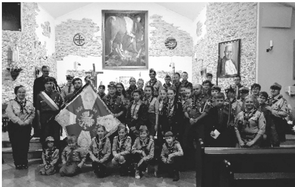
Jak zwykle harcerska brać pozowała do zdjęcia wraz ze swoim kapelanem.

Instruktorzy oraz harcerze z 8 SDSH uczestniczyli również w kolejnym rajdzie pieszym z cyklu: „100 Kilometrów na Stulecie Odzyskania Niepodległości”, tym razem szlak prowadził z Brzozy do Solca Kujawskiego. Organizatorem rajdów są: Muzeum Solca, PTTK Horyzont oraz Hufiec ZHP Solec Kujawski.