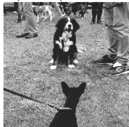
A ja jeszcze bez medalu...