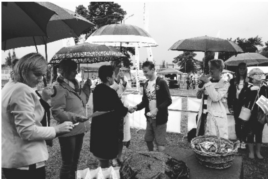
Sama wystawa, jak i wręczanie nagród konkursowych odbyły się w niesprzyjających okolicznościach przyrody.

W kategorii klasa w SP Nr 4 zwyciężyły: I miejsce - kl. I C , II miejsce - kl. V E , III miejsce - kl. I B ; w GP Nr 2: I miejsce - kl. II D , II miejsce - kl. II A , III miejsce - kl. II B ; w SP Nr 1: I miejsce - kl. I B , II miejsce - kl. I A , III miejsce - kl. III C .