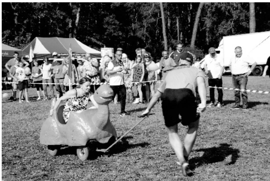
Wejście w niektóre zakręty było o wiele trudniejsze. Zdarzały się wypadki.