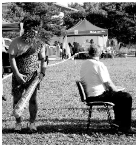
Panie sędzio! Uwaga z tyłu!