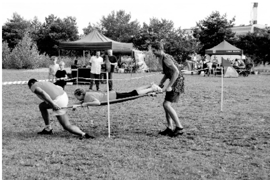
O mały włos od „tragedii”.