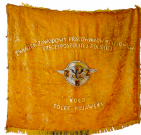
Sztandar Związku Zawodowego Pracowników Kolejowych RP. Koło Solec Kujawski.

Sztandar będzie można zobaczyć na wystawie „Nabytki”, której otwarcie planowane jest na połowę stycznia 2019 r. Na wystawie tej będzie także wiele innych ciekawych eksponatów, między innymi takich, które zostały znalezione dzięki niskiemu poziomowi wody w Wiśle.