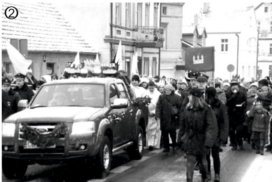
Orszak wyruszył sprzed kościoła NSPJ (fot. 1) i przeszedł ulicami Solca (fot. 2). Trzej Królowie pozdrawiali mieszkanców (fot. 3), by później oddać pokłon Jezusowi narodzonemu w żłóbku (fot. 4). Uczestnicy orszaku licznie wypełnili widownię naszej hali (fot.5) i obejrzeni jasełka.

Nie wielbłądy, ale konie... mechaniczne wiozły trzech króli po soleckich ulicach podczas tegorocznego Orszaku Trzech Króli, zorganizowanego 6 stycznia w święto Objawienia Pańskiego czyli tzw. Trzech Króli. Po mszy, spod kościoła Najświętszego Serca Pana Jezusa setki solecchan wyruszyły do Ośrodka Sportu i Rekreacji, gdzie królowie oddali pokłon narodzonemu Jezusowi i przekazali dary: złoto, kadzidło i mirrę. Uczestnicy przemarszu, zorganizowanego w Solcu po raz pierwszy, mieli na głowach korony czerwone, białe i niebieskie, symbolizujące kolory soleckiej flagi. Kiedy już szczerlnie wypełnili widownię hali OSiR-u, obejrzeni jasełka przygotowane przez soleckich uczniów. Uroczystość zorganizowały soleckie parafie, szkoły, przedszkola, SCK, OSiR i urząd miasta.