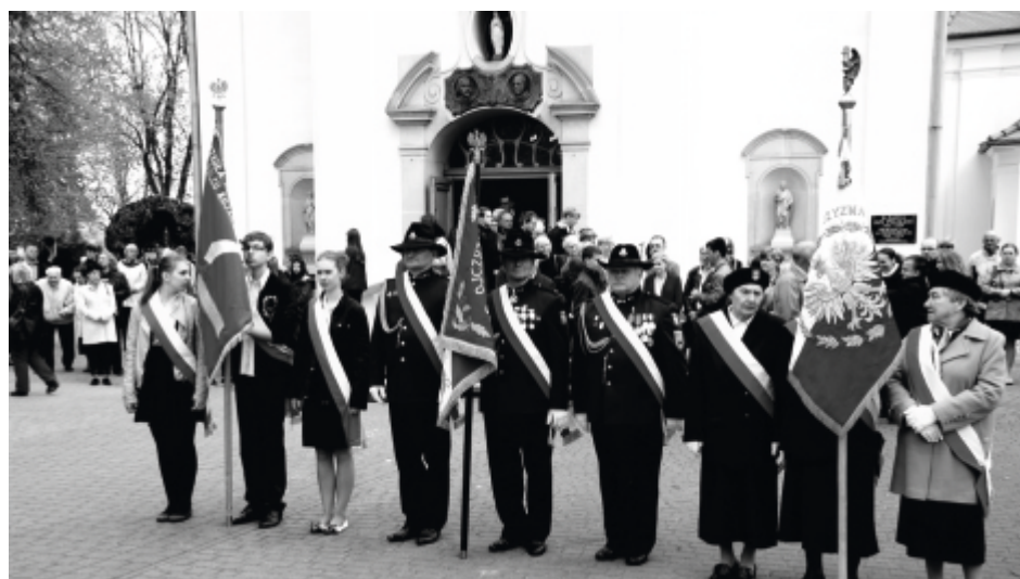
Po mszy za Ojczyznę odprawionej w kościele św. Stanisława z okazji rocznicy uchwalenia Konstytucji 3 maja delegacje samorządu, sołeckich organizacji i instytucji złożyły kwiaty pod Pomnikiem Niepodległości. 8 maja uczynią to ponownie – tym razem dla upamiętnienia zakończenia II wojny światowej oraz jej ofiar. Zbiórka delegacji przed urzędem miasta o godz. 10.15.