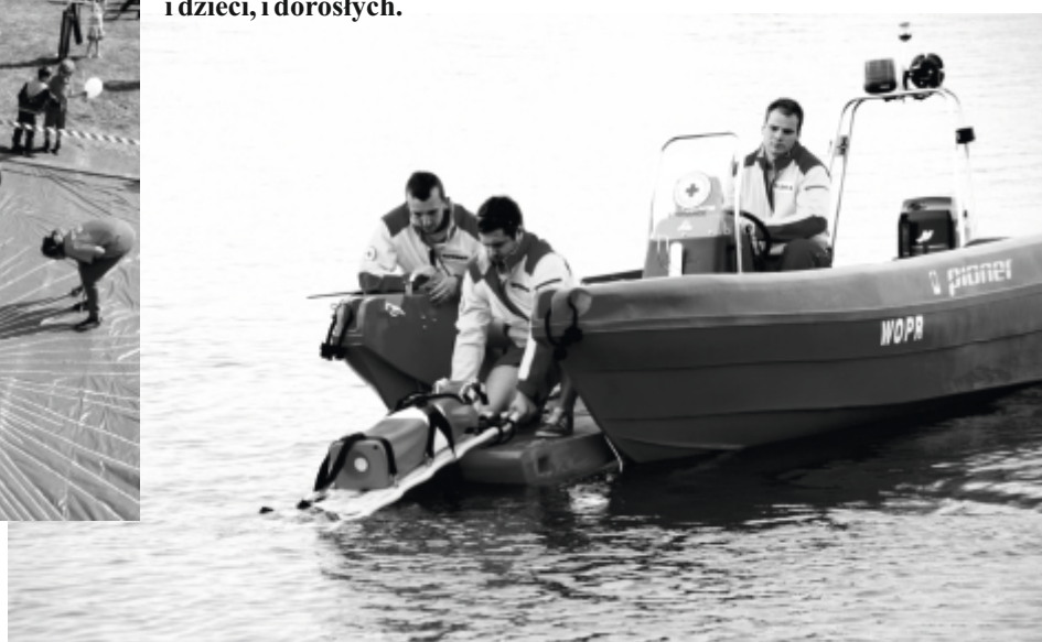
Ratownicy soleckiego WOPR podczas pokazów na swojej nowej łodzi.

Ułożenie kilometrów dobra zebranych złotówek trwało i trwało i trwało - tyle ich było. Dzięki akcji Stowarzyszenie im. Sue Ryder kupi ambulans medyczny.