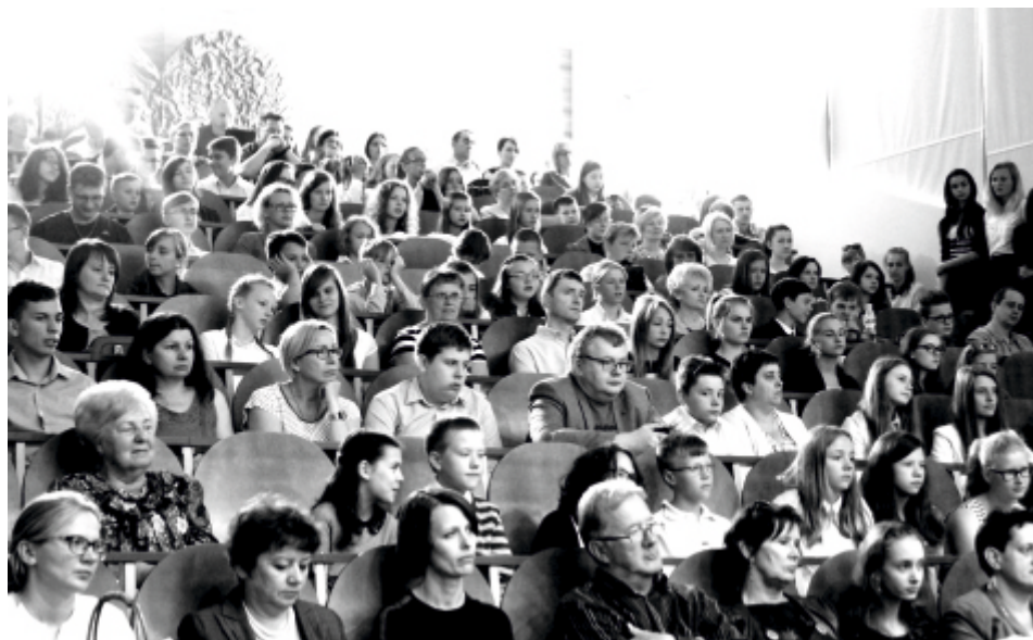
fol. S. Wójtewicz

znaleźli się także uczniowie odnoszący sukcesy w wioślarstwie, kajakarstwie, strzelectwie, piłce nożnej, kulturystyce, żeglarskim, koszykówce oraz siatkówce.