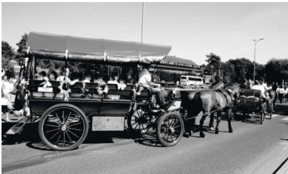
Mimo że na boisku sportowym można było zobaczyć wystawę nowoczesnego sprzętu rolniczego, królowały pojazdy ciągnięte przez prawdziwe konie.