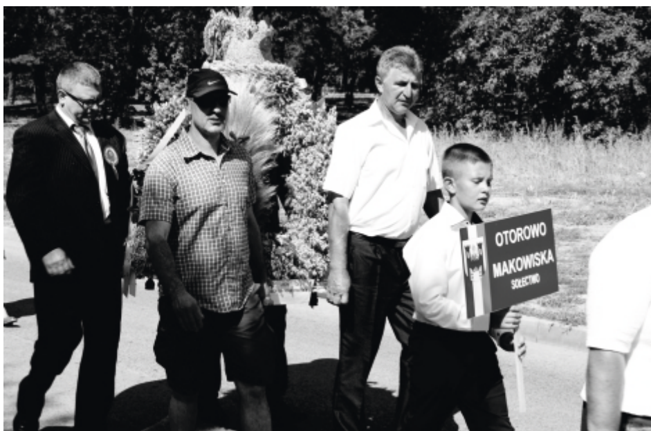
W korowodzie przedstawiciele sołectw nieśli wieńce dożynekowe, a pozostali uczestnicy - dożynekowe ozdoby.