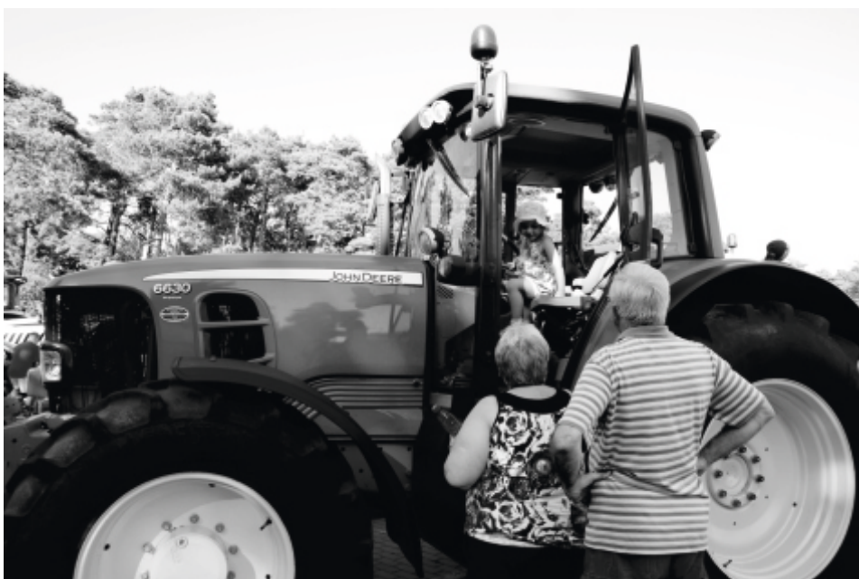
Obok takich ciągników były również nieco starsze egzemplarze. Ale i one cieszyły się popularnością wśród mieszkańców.