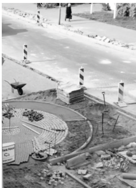
Piękną chodniki przy ul. 23 Stycznia.

Powstający punkt obsługi podróżnych dofinansowany jest ze środków Unii Europejskiej w ramach Programu Operacyjnego Infrastruktura i Środowisko.