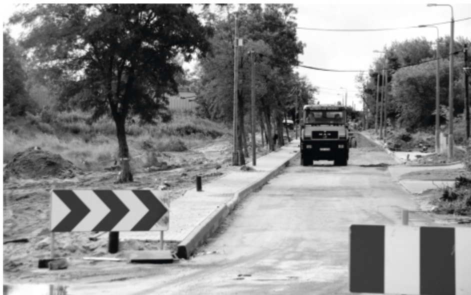
Ulica Lipowa zmienia się nie do poznania.

W tym roku powinna być gotowa dokumentacja na ul. Ogrodową. Przyszły rok to staranie się o dotację na remonty ul. Sienkiewicza i 29 Listopada, co związane jest z poprawą bezpieczeństwa dojazdu do szkół. Gmina myśli również o rozbudowie ścieżek rowerowych np. z Otorowa do ronda przy wiadukcie, czy przez Przyłubie do drogi krajowej, a także łączącej Osiedle Leśne ze Szkołą Podstawową nr 4 oraz centrum miasta z Zespołem Szkół przy ul. Tartacznej.