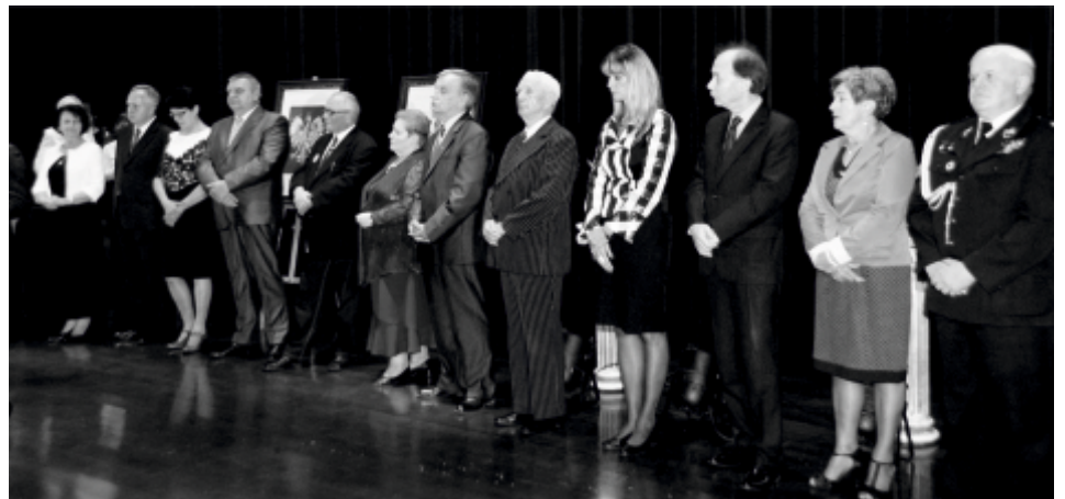
Odnaczeni medalami „Za zasługi dla Solca Kujawskiego.