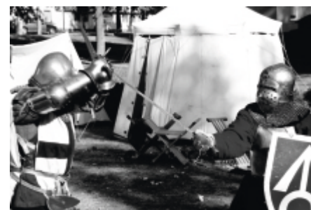
Jedna z walk pokazowych.