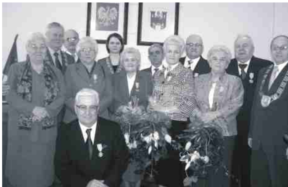
Pięć par małżeńskich z naszego miasta otrzymało medale "Za długoletnie pożycie małżeńskie", przyznawane przez Prezydenta RP. Więcej na str. 5