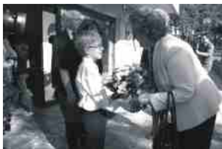
Przed koncertem w SCK.

Chciałabym się uczyć w takiej szkole. Można pisać palcem na jakiejś wirtualnej mapie i to będzie odtworzone. Nie ma kredy, nie ma ławek, w których siedzi sześcioro, siedmioro dzieci. Młodzież dzisiaj jest przyzwyczajona, że ma wiele nowych rzeczy, ale czy to doceni? Chciałabym uzmysłwić uczniom, czy zdają sobie sprawę z tego, co dostali. Mają obowiązek tylko się uczyć. Nie martwisz się, że nie masz co jeść, że nie masz ubrania. To wszystko masz. I tylko proszą cię się.