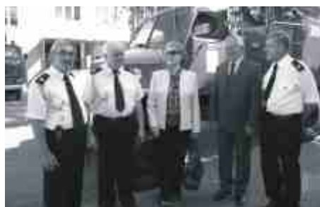
Z wizytą w OSP.