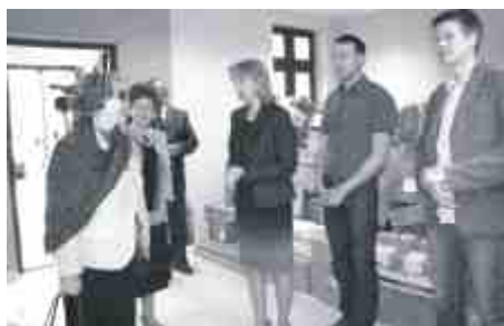
W Centrum Aktywności i Edukacji.

Byłam też na koncercie szkoły muzycznej i dowiedziałam się, że te instrumenty, na których grały dzieci są kupione przez samorząd i są do ich dyspozycji.