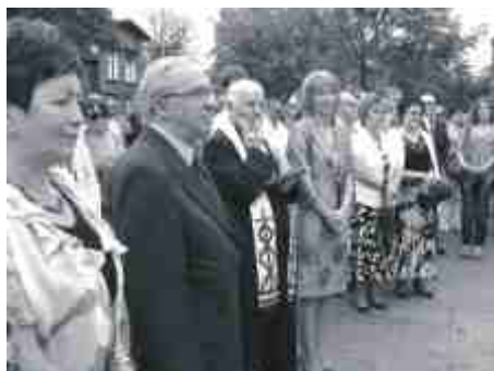
Przybyło wielu gości.

Projekt utworzenia Centrum Aktywności i Edukacji został dofinansowany z Europejskiego Funduszu Rozwoju Regionalnego w wysokości 1,6 mln zł, a całkowity jego koszt to 2 mln zł.