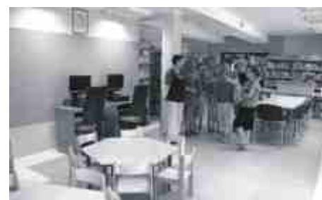
Budynek wygląda imponująco. Również w środku.