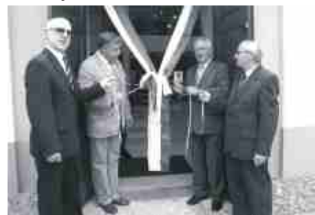
Symboliczne otwarcie Centrum Aktywności i Edukacji.