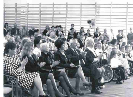
Przybyło wielu gości.

Na zakończenie części oficjalnej uczniowie zaprezentowali przedstawienia, potem goście mieli czas na obejrzenie nowej szkoły. W jednej z sal do ćwiczeń obejrzeni pokazy karateków z klubu Kyokushin, następnie zwiedzili wszystkie zakamarki szkoły. Zarówno kurator oświaty, jak i przedstawicielka Ministerstwa Edukacji Narodowej byli pod wrażeniem rozmachu, z jakim wybudowano szkołę.