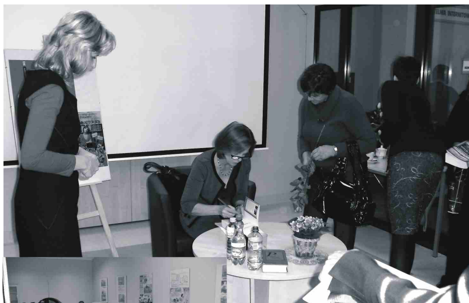
Pisarka podpisywała swoje książki.

Autorka na tyle zainteresowała uczestników swoją osobą i pisarstwem, iż sięgają oni z chęcią po kolejne nieprzeczytane jeszcze książki pisarki.