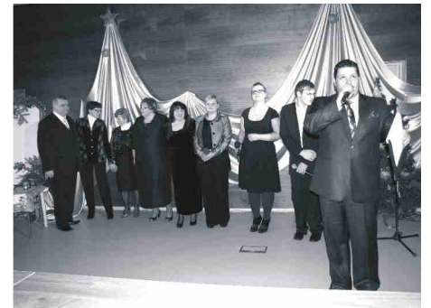
Kolędnicy w auli Zespołu Szkół.