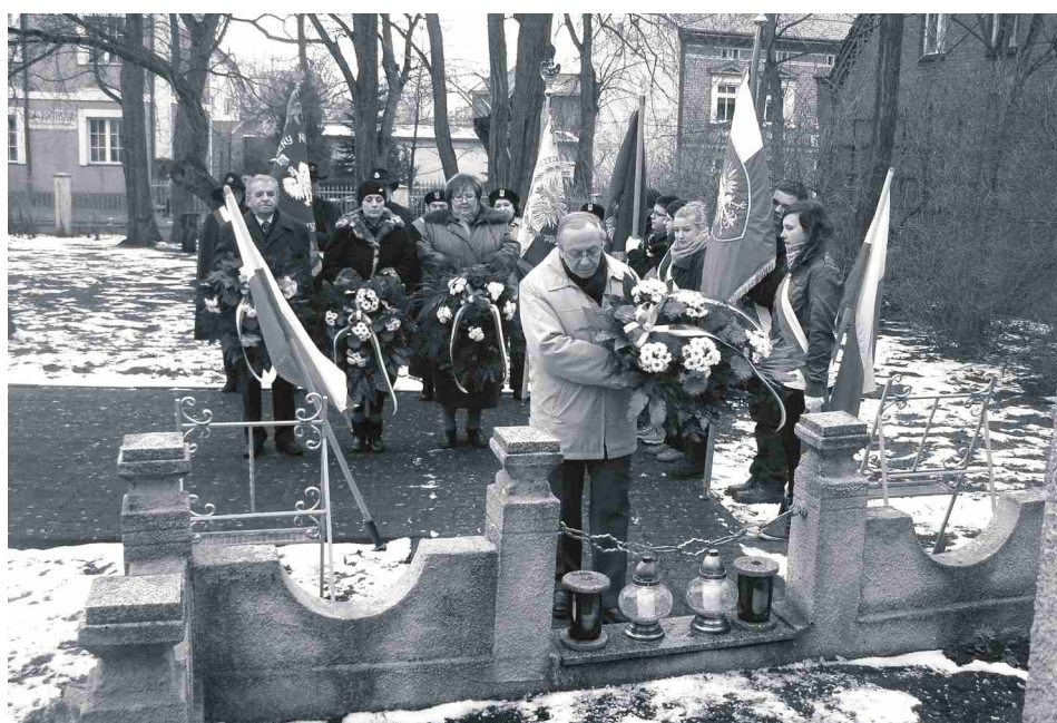
19 stycznia - odzyskanie przez nasze miasto niepodległości w 1920 r. i 23 stycznia - zakończenie niemieckiej okupacji były, jak co roku, powodem do uczczenia pamięci wszystkich, którzy walczyli o niepodległość Polski.

Wszystkie osoby chcące zapoznać się z protokołem z sesji rady miejskiej mogą to zrobić w biurze rady miejskiej lub na stronie Biuletynu Informacji Publicznej naszej gminy: www.bip.soleckujawski.pl