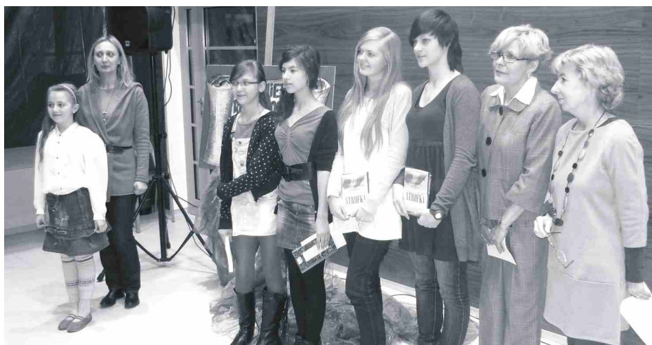
Laureatki konkursu razem z jury.

Uwaga! W piątek 23 marca ostatni dzień zapisów. Bliższe informacje i pomoc merytoryczna w SCK przy ul. Kościuszki 12 w pokoju nr 17.