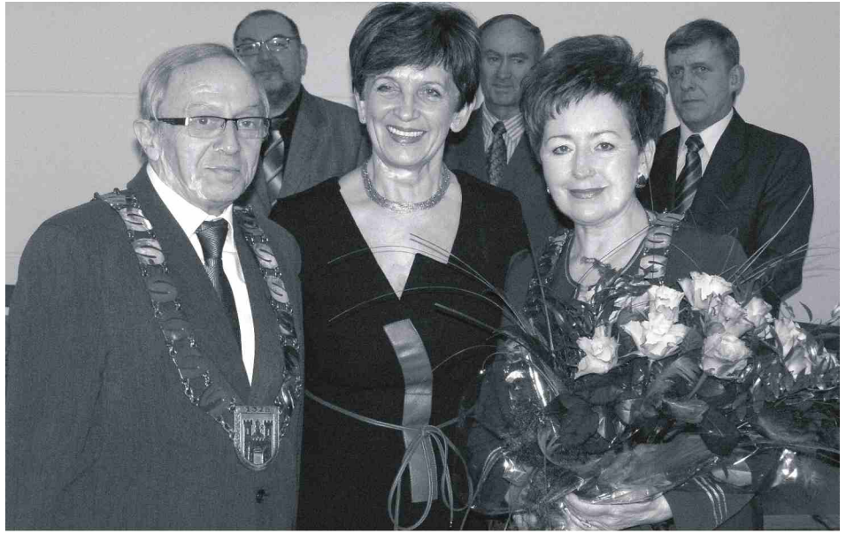
Gratulacje złożyła wojewoda Ewa Mes (w środku).