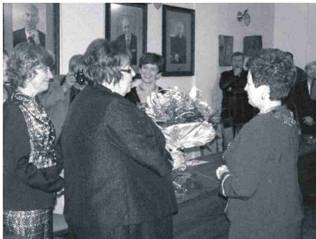
Kwiaty przekazali przedstawiciele zarządów osiedli, sołectw i urzędu miasta.